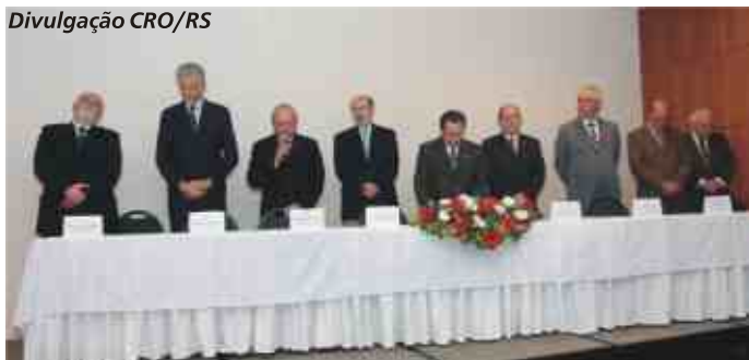
Autoridades políticas e classistas prestigiam evento

A Solenidade de Abertura do II Encontro Sul Brasileiro de Saúde Bucal, transcorrido em Porto Alegre/RS, dia 29 de setembro, deu mostras do que seria o evento.