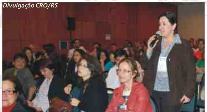
Participação do público foi marca do evento