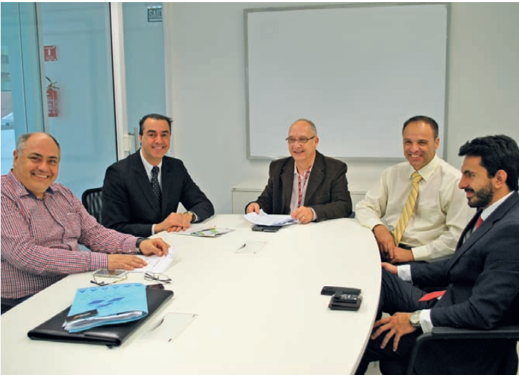
Convênio: acesso a tecnologia de ponta

Banrisul aproxima CDs com tecnologia de última geração em recebimentos eletrônicos