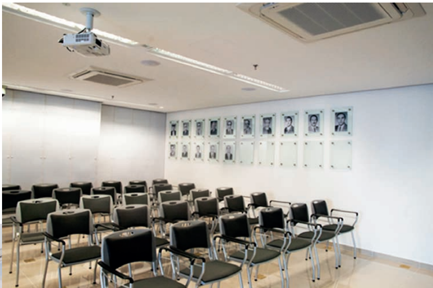
Anfiteatro com capacidade para 150 pessoas