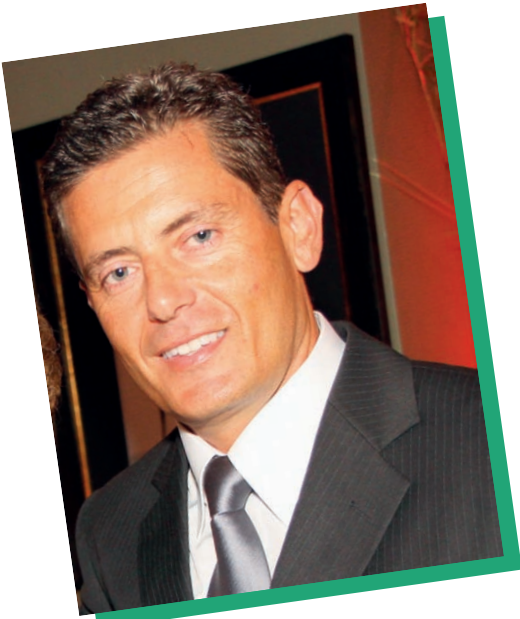
Etzberger: falta de saúde bucal e queda de rendimento

Apesar de a Odontologia do Esporte não ser uma especialidade reconhecida pelo Conselho Federal de Odontologia, vem se consolidando no eixo Rio-São Paulo, e se tornou um importante campo de atuação para os cirurgiões-dentistas. A procura por profissionais da saúde bucal parte de lutadores, devido ao crescente interesse da mídia sobre os mesmos. O cuidado odontológico para praticantes de outros esportes, ainda é uma prática secundária, ou mesmo ignorada.