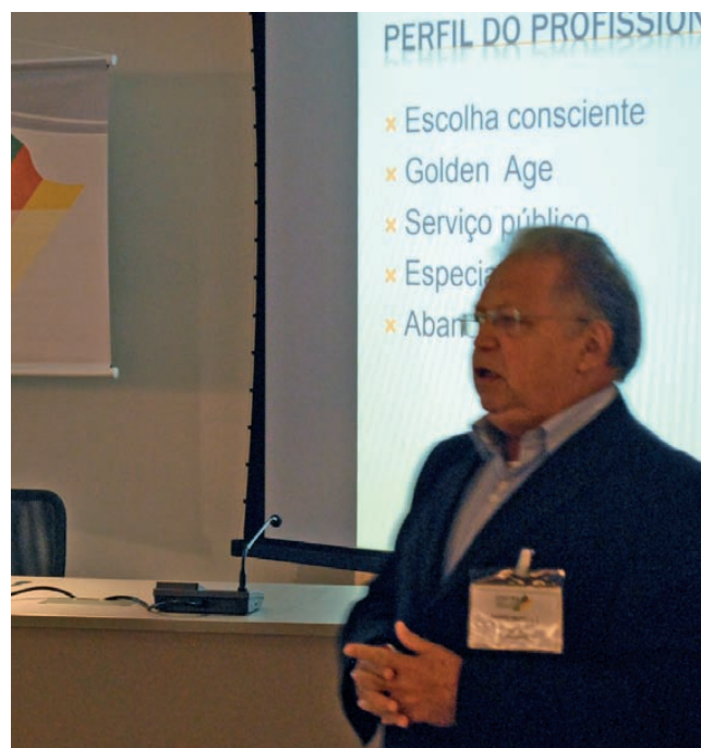
Profissional deve estar informado

O curso propiciou um espaço para discussão sobre assuntos da Odontologia, direito, contábil, endomarketing, relações humanas, ética e fidelização do cliente.