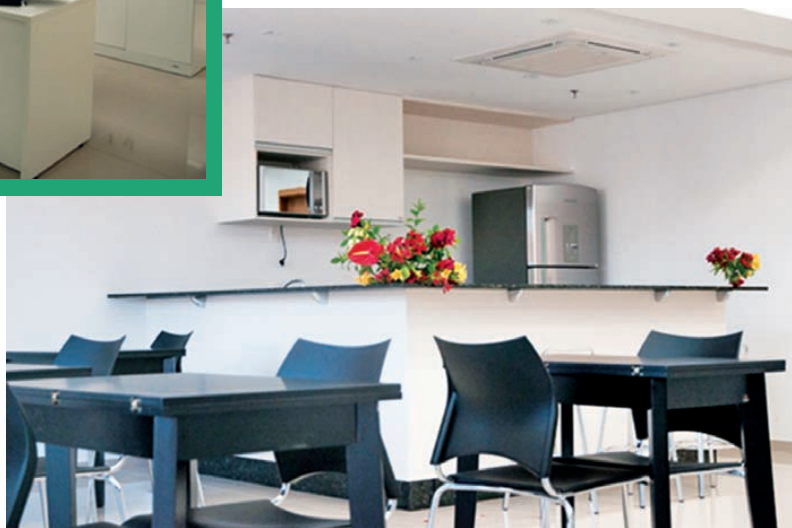
Espaço social para confraternização de colegas