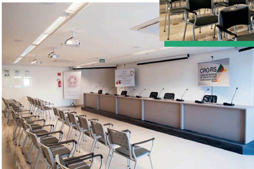
Espaço funcional e modular abrigará eventos definidos pelos inscitos