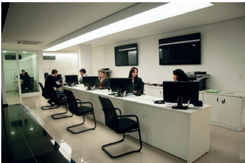
CRO Fácil: um atendimento para todas as demandas