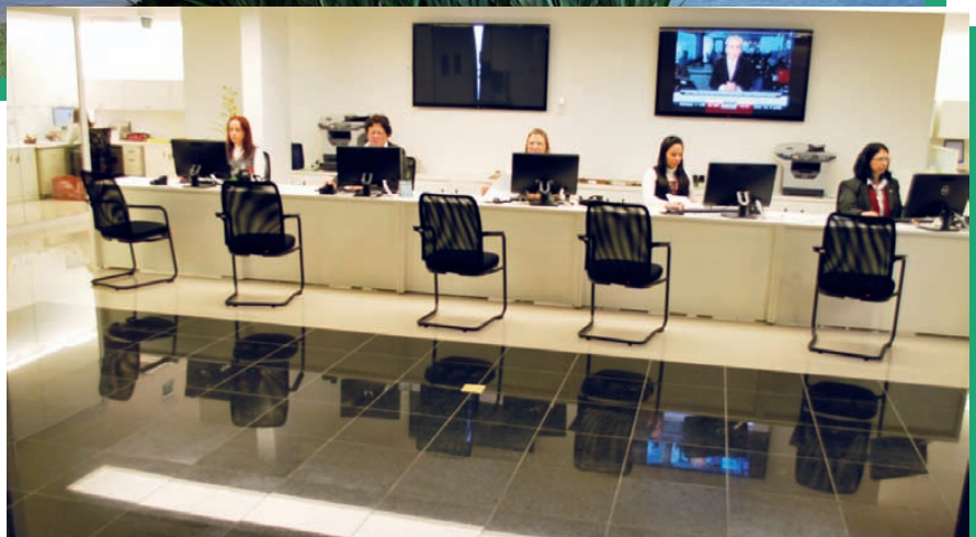
CRO Fácil: um atendimento e várias demandas