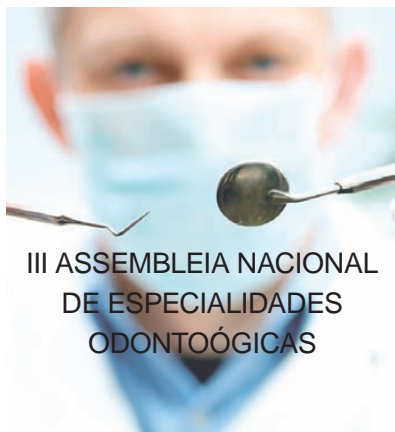
III ASSEMBLEIA NACIONAL DE ESPECIALIDADES ODONTOLÓGICAS

O CRO/RS promoveu (12/8) um encontro com profissionais, representações de entidades de classe e instituições de ensino, com objetivo de gerar um debate regional e encaminhamentos para a III Assembleia Nacional de Especialidades Odontológicas – ANEO, que